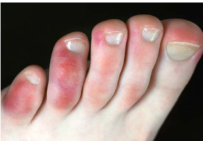
Abb. 3 Chilblain-like Läsionen (sogenannte „Covid-Zehen“)

Außer den oben beschriebenen klinischen Manifestationen wurden bei einer SARS-CoV-2-Infektion auch andere Dermatosen beschrieben (Zhao et al. 2020).