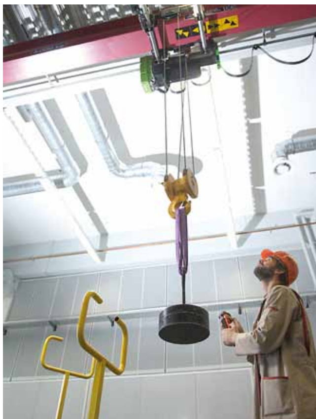
Bedienung des Brückenkrans in der Mehrzweckhalle

Der Raum eignet sich ebenso für Konferenzen und Ausstellungen.