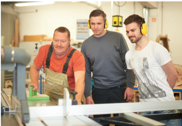
Fräsen mit Schablonen