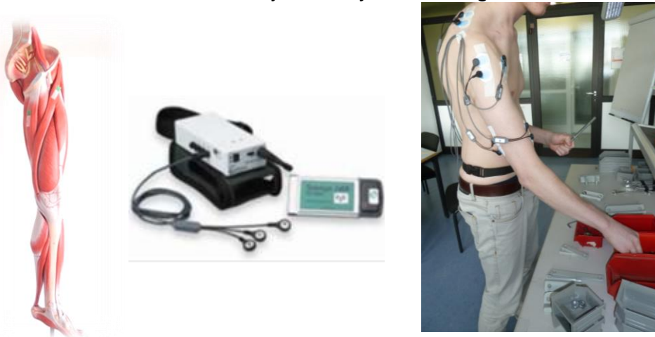
Abbildung 3: Darstellung der EMG Erfassung (Links: Anatomie der Muskel der unteren Extremitäten; Mitte: Messsystem mit TeleMyo G2 von Noraxon; Rechts: Anwendung).

Das Messsystem CUELA kann die Bewegungen und Belastungen des Muskel-Skelett-Systems am Arbeitsplatz unter realen Arbeitsbedingungen erfassen und analysieren. In diesem Projekt liegt – neben der Ganzkörpererfassung – der Schwerpunkt auf der Analyse der Belastungen des Hand-Arm-Systems, um mögliche Engpässe im Sinne von Monotonie, Repetition und Zwangshaltungen in Verbindung mit dauerhaft erhöhter Muskelanspannung und unzureichenden Erholzeiten aufzudecken (Glitsch et al. 2012). Für diesen Zweck werden Körperhaltungs- und Bewegungsdaten mit dem CUELA-Hand-Arm-System erfasst (Abbildung 4). Gleichzeitig werden die muskel-physiologische Belastungen der oberen Extremitäten mit dem EMG-Modul des CUELA-Systems synchron aufgezeichnet.