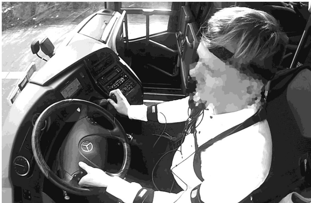
Abbildung 1: Versuchsperson mit CUELA-Activity-System während der Messung

Es werden 16 Messungen bei sechs männlichen Busfahrern im Alter von 27 bis 64 Jahren (MW: 43; SD: 14) durchgeführt, davon neun im Langstrecken- und sieben im Stadtverkehr. Die Datenerhebung erfolgt mit dem CUELA-Activity-System (Weber 2007), welches die Physische-Aktivitäts-Intensität (PAI) mit Hilfe von 14 Sensoreinheiten, die jeweils aus einem Accelerometer und einem Gyroskop bestehen, am Kopf, der Brust- und Lendenwirbelsäule, der oberen und der unteren Extremitäten der Fahrer erfasst (s. Abb. 1).